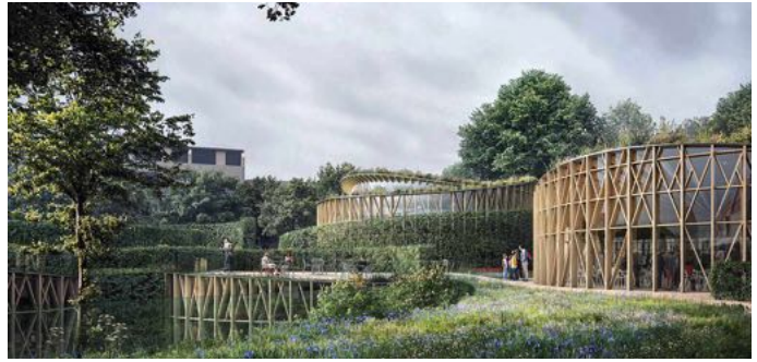
Das neue H.C. Andersens Haus (Eröffnung Herbst 2021)