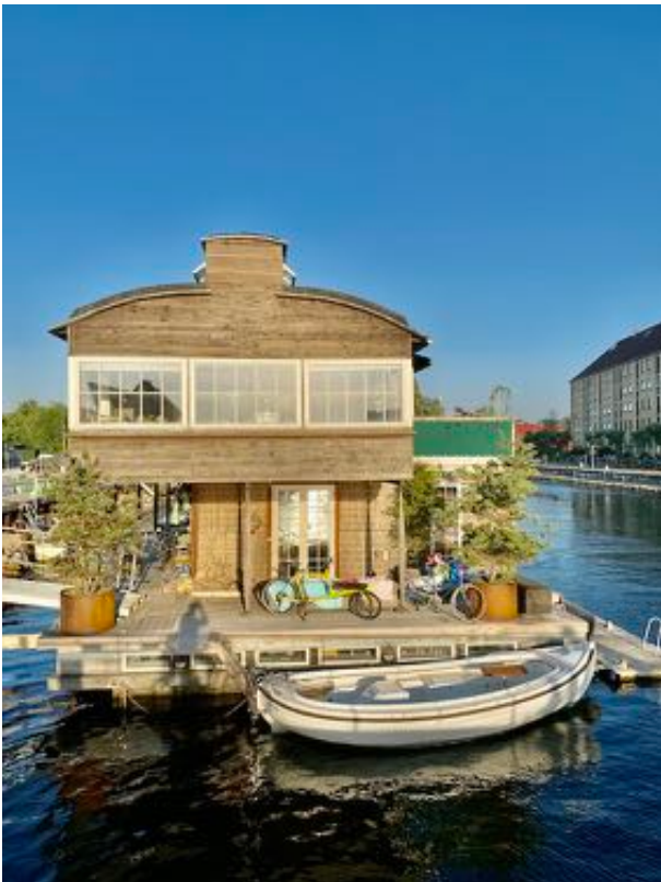
Hausboot in Kopenhagen