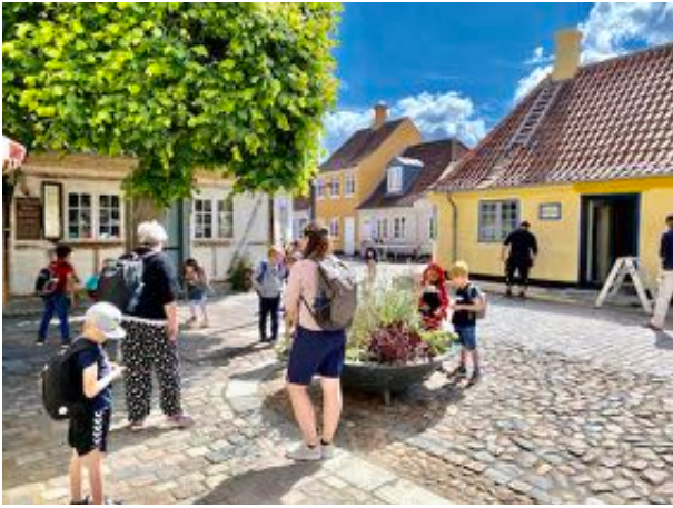
Geburtshaus von H.C. Andersen in Odense