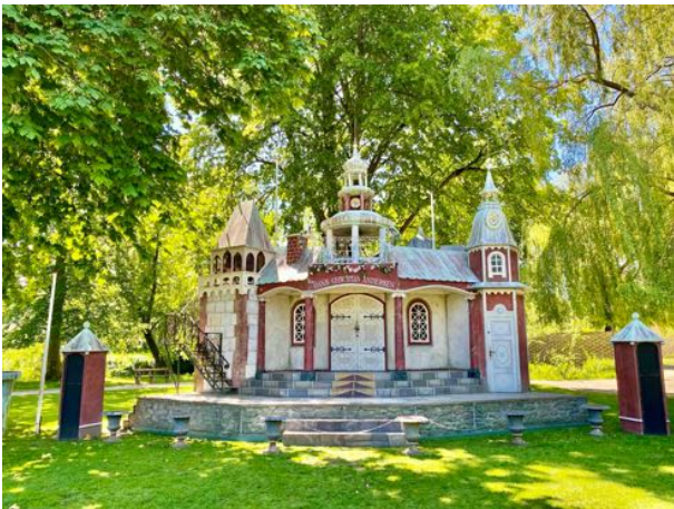
Märchenbühne in Odense, Geburtsort von H.C. Andersen